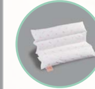
Rhomo-med® Multikissen (gekammertes Beinkissen)

Art.Nr. Größe 46.900 15 x 30 cm Hilfsmittelnr.: 11.11.05.1012