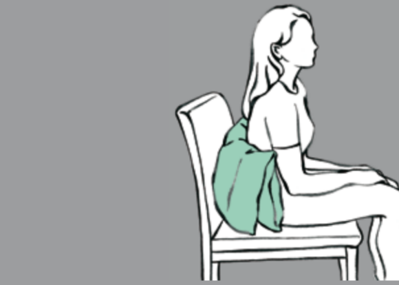
Stabilisiertes Sitzen - Schulterblatt frei