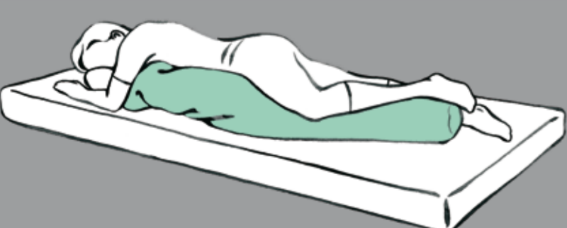
Wahrnehmungsförderung der Körpervorderseite