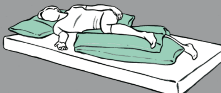
Liegen auf der betroffenen Seite