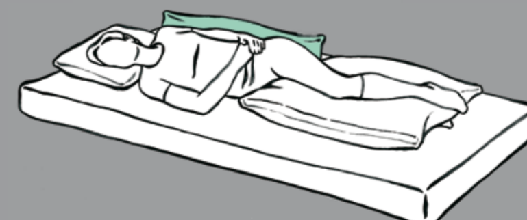
Minimale Verlagerung des Kissens im Rücken