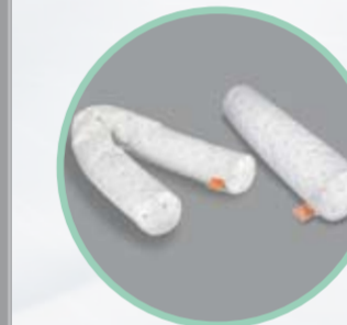
Rhomo-med® Rolle zur Positionsunterstützung

Art.Nr. Größe 46.100 Ø 20 x 100 cm 46.200 Ø 20 x 220 cm Hilfsmittelnr. für 46.100: 11.11.05.1006 Hilfsmittelnr. für 46.200: 11.11.05.1005