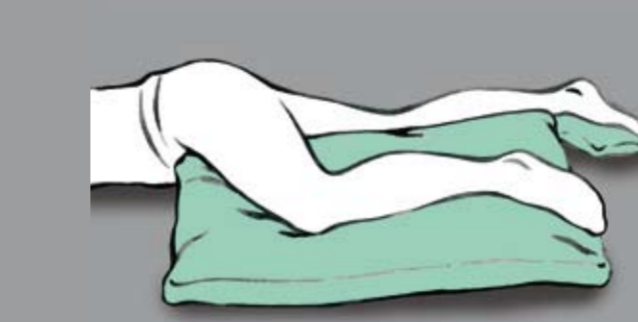
Unterstützung des betroffenen Beines als Ganzes