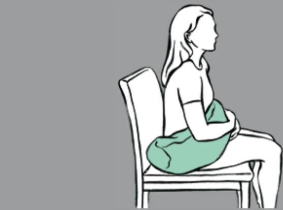
Schließen der offenen Seite