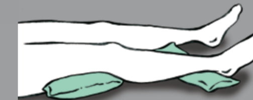
Minimale Verlagerung unter dem Bein