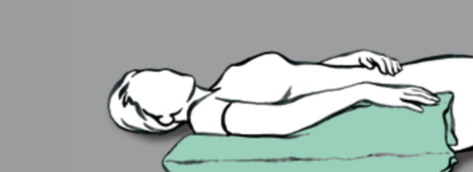
Arm hochlagern zur Oedemprophylaxe