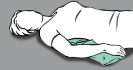
Minimale Verlagerung des Kissens unter dem Arm