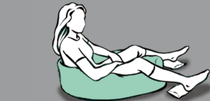
Blockierung der Zwischenräume