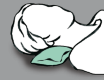
Minimale Verlagerung unter dem Kopf