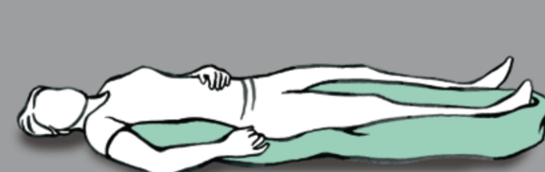
Wahrnehmungsförderung der rechten Körperhälfte