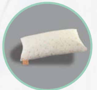
Rhomo-med® Lagerungskissen mit Seitenboden

Art.Nr. Größe 46.100 Ø 20 x 100 cm 46.200 Ø 20 x 220 cm Hilfsmittelnr. für 46.100: 11.11.05.1006 Hilfsmittelnr. für 46.200: 11.11.05.1005