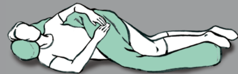
Unterstützung der diagonalen Muskelstränge