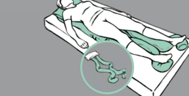
Wahrnehmungsförderung des gesamten Körpers