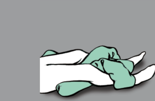
Wahrnehmungsförderung der diagonalen Muskelstränge